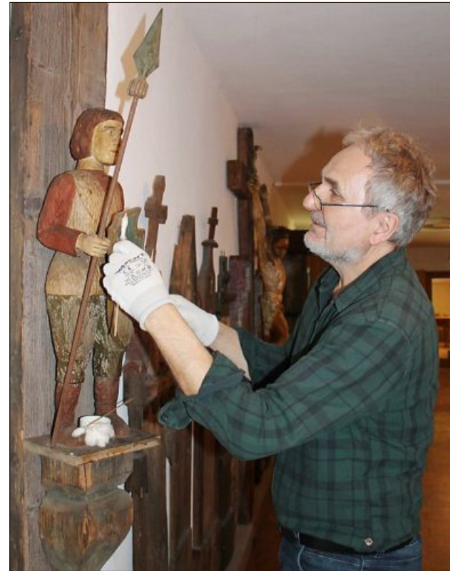
Deutlich sind an der „Hose“ des hölzernen Ritters die Schimmelflecke zu sehen.

len ist. Empl zeigte sich überrascht von der Vielfalt der Objekte aus den verschiedensten Epochen und den vielen, unbekanntenen Exponaten. So gibt es im Raum der Musikinstrumente drei wunderschöne Harfenzithern, auch sie wurden sorgfältig gereinigt.